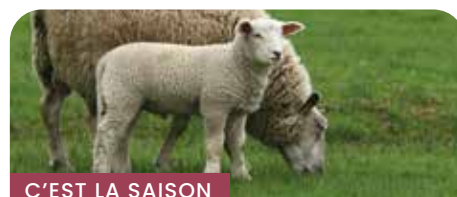
C'EST LA SAISON

Le terme «légume vert» n'est pas lié à la couleur des végétaux, mais à leur fraîcheur qui les différencie des légumes secs. 40 millions de pieds de salade sont produits dans la plaine du Roussillon, principalement d'octobre à avril. Avec près de 400 ha, nous sommes le 1 er département français producteur de laitues . En termes de variétés, on retrouve des batavias, des feuilles de chêne, ainsi que des scaroles et frisées de la famille des chicorées. Nos salades, reconnues pour leur qualité et leur disponibilité en hiver, s'expédient dans la France entière et en Europe du nord. D'autres légumes verts sont aussi des spécialités de la plaine du Roussillon comme le céleri branche, mais aussi depuis quelques années : le fenouil, le brocoli, la blette, l'épinard... Une commune a même donné son nom à une variété de céleri branche : le vert d'Elne.