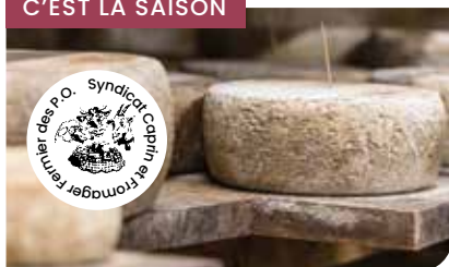
C'EST LA SAISON

- Les tommes : au lait cru, à pâte pressée, affinées en cave pendant six semaines à quatre mois, voire plus.